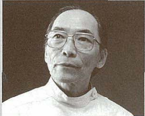
■田中信昭(指揮) Nobuaki TANAKA

田中信昭とびわ湖ホール声楽アンサンブルが鮮やかに描き出す、世界の音楽における律動の様々をお楽しみください。